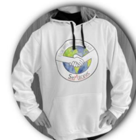
Sudadera UCI SIN FRONTERAS