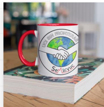
Taza UCI SIN FRONTERAS

Además, pueden adquirir merchandising de UCI Sin Fronteras a través de nuestra tienda online . En este caso, el beneficio neto de cada compra se destinará a UCI Sin Fronteras.