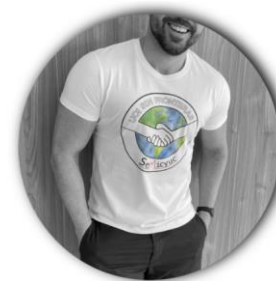
Camiseta UCI SIN FRONTERAS